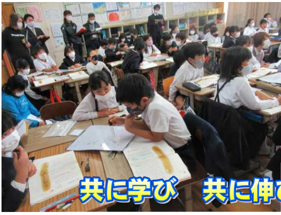
共に学び 共に伸びる あもりっ子