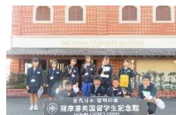
12/11 英国留学生記念館見学