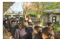
12/8 中学校乗り入れ授業