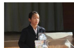
11/29 ビブリオバトル大会