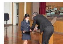
伊集院税務署長様より表彰を受けました。