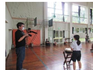
7/13に1回目の撮影がありました

例年夏休みは太鼓出演の依頼を多数受け、準備をするところですがコロナ禍のため発表の機会がありません。そこで、1学期のまとめとして7月20日（火）の13:10より荒川小体育館で太鼓発表会を開催することになりました。1年生の3名もデビューします。また、三宅太鼓は、3年生以上の8名が演奏します。4月から週1回昼休みに自主練習を続けてきました。練習の成果を発揮して欲しいです。なお、当日はプロのカメラマンの方に荒川太鼓の動画撮影をお願いしています。撮影した動画は、現在改装中の旧蓑手商店の室内で鑑賞できるとのことです。また、YouTubeにアップすることも検討中です。