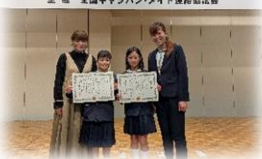
認知症サポーターキャラバン令和6年度 表彰・報告会 主催 全国キャラバン・メイト連絡協議会

全国で約1600万人を数える認知症サポーター。キッズサポーターとして認知症啓発のポスター作りに取り組み、優秀賞(2名)と学校賞をいただきました。東京で行われた表彰・報告会では、今後の活動のヒントを得ることができました。今後も地域共生社会に向けた取り組みを積極的に展開していきます。