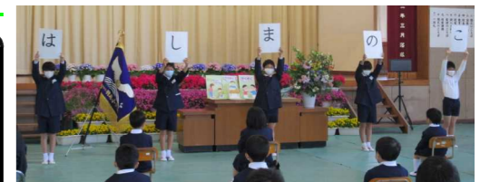
6年児童からの歓迎のこたば

4月6日に入学式が行われました。とても元気で、目がキラキラと輝いた5名が入学しました。全員が堂々とした姿で入場し、落ち着いた態度で式に臨むことができました。