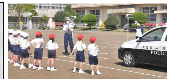
横断歩道の安全な渡り方