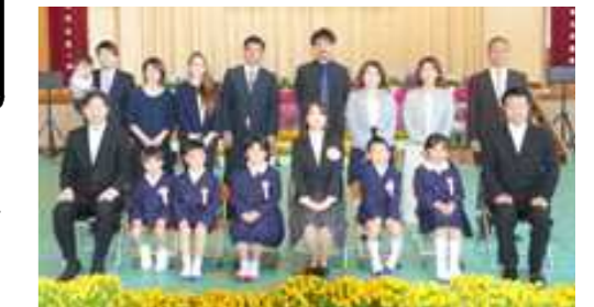
令和4年度入学生5名