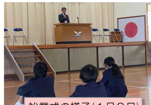
始業式の様子(1月9日)

3学期が始まりました。1月9日の始業式の日には子供たちは元気に登校し、気持ちよくスタートすることができました。始業式では、各学年の代表が新年の目標を発表しました。「持久走で自己新記録を更新する」「勉強をがんばる!」など、それぞれの学年に応じた目標を発表することができました。ますます寒さが厳しくなり、感染症の動向も気になりますが、学校では「元気と健康、安全」を第一に考え、引き続き対応を図っていきます。