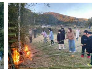
(辰年の火付け役児童)