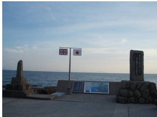
萬造寺齋の生涯の地 羽島