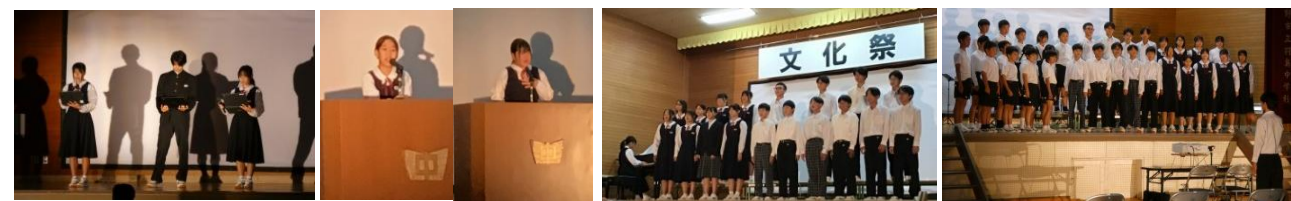
【生徒会オープニング】 【トピクトーク、英語弁論】 【全校合唱「カイト」】 【小 5・6 年生中学生合唱】

11 月 5 日、文化祭を実施しました。生徒たちは、「The best way to end～羽島中の終わりと始まりを 23 人で～」のスローガンを掲げ、限られた練習時間の中で、一生懸命に準備をして当日を迎えていました。今年も羽島小学校 5・6 年生が参加し、合唱とリコーダー奏を披露しました。参観していただいた保護者や地域の皆様からは、演劇、表現が素晴らしかったとの声をかけていただき、生徒たちも喜んでいました。また、舞台発表の前後の時間に、展示作品を見ていただき、日頃の学習活動を感じていただくことができました。たくさんのご来場ありがとうございました。