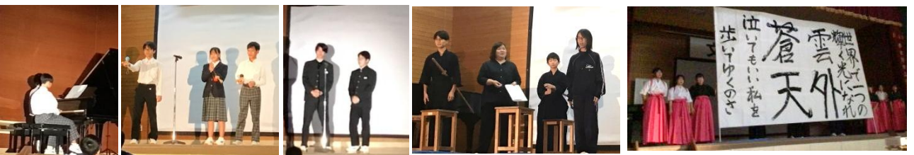
【表現班「いつか、また、ここで」