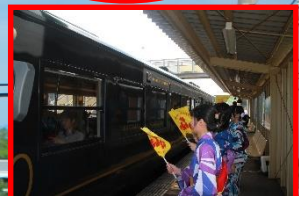
いぶたま・おもてなし