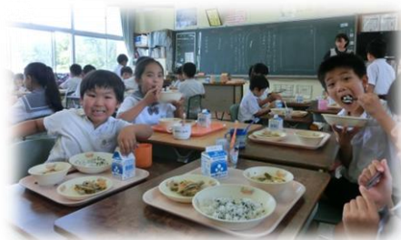
楽しい思い出ができたね

小学生の2人には、市来小での楽しい思い出を忘れずに海外で活躍してほしいです。そして、また来年体験入学にきてほしいです。市来小の子どもたちには、外国のことや英語に更に興味をもってもらい、来年は英語で会話ができるようになってほしいです。