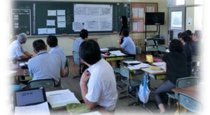
ワークショップ型研修