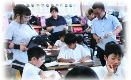
児童の反応をタブレット撮影

新学習指導要領では、国語の「読むこと」において「交流」から「共有」に発展しています。当日は、その本質にせまる問題提起や課題追究する対話が生まれ、充実した校内研修となりました。今後も「チームとして高め合う教師集団」でありたいものです。