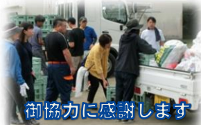
御協力に感謝します

また、9月1日(日)には、PTAリサイクル活動がありました。保護者や地域の方々の御協力で、たくさんの資源回収ができました。益金を今後の教育活動に生かしていこうと思えます。御支援ありがとうございました。