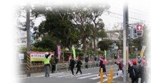
安全運転をお願いします

また、保護者の方には、送迎時の運転や降車時の安全確認・安全運転を呼びかけて、無事故が継続しています。これからも、子どもたちの安全を第一に考えた運転をお願いします。