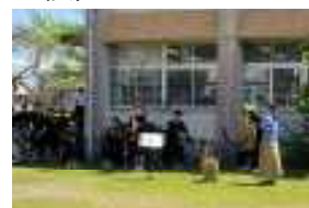
《吹奏楽部アフタヌーンコンサート》