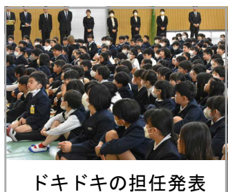
ドキドキの担任発表