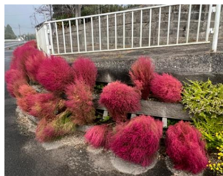
【紅葉するホウキギ】

本年もあとわずかとなりました。保護者や校区の皆様には、学校行事や児童のことで、何かとお世話になりましたことに感謝いたします。児童らが学校に行きたい、友達に会いたい、勉強が楽しい、給食がおいしいと何か一つでも毎日の楽しみをもちながら登校できるように、来年も職員が一丸となって校区の中の学校として、教育活動に取り組んでまいります。お願いすることもあると思いますが、来年もどうぞよろしくお願い申し上げます。