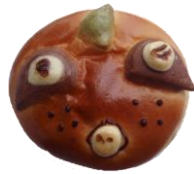
つるみんジャームパン