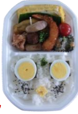
つるみんジャー弁当