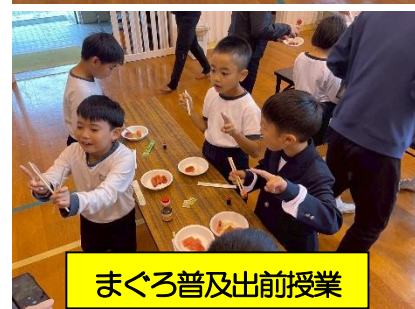
まぐろ普及出前授業