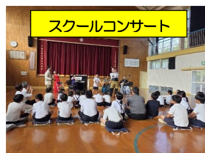
スクールコンサート