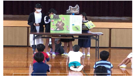
図書委員会による読み聞かせ