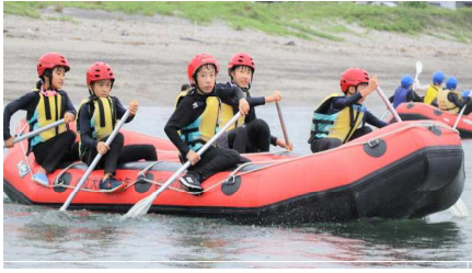
宿泊学習（大隅青少年自然の家）