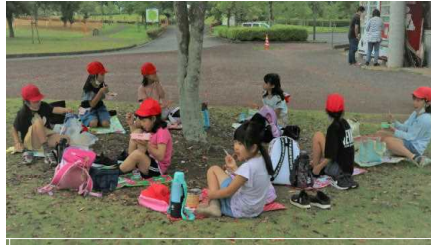
一日遠足（観音池，都城市立図書館）