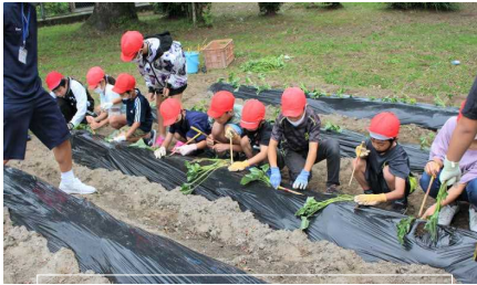
2年，5・6年生 芋の苗植