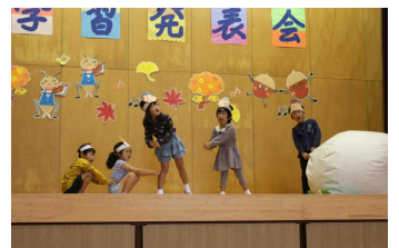
1・2年劇「大きなかぶ」