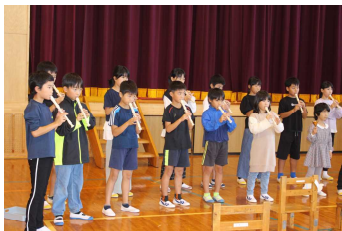
全校合奏♪「オーラリー」 斉唱♪「手をつなごう」