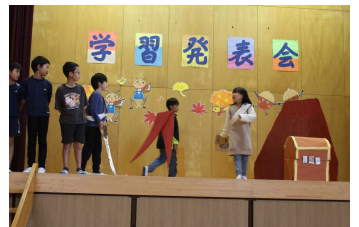
3・4年創作劇 「たから島のぼうけん」