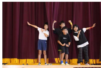
脚本・監督・小道具作り等全て自分たちで創り上げた 5・6年 創作劇「小学校の1日」