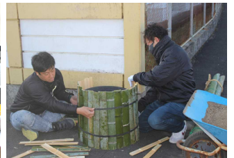
新年を迎える門松作り