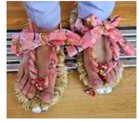
12/15 (日) 山下数弘様, 山下陽子様たちとわらじ作り (家庭教育学級)