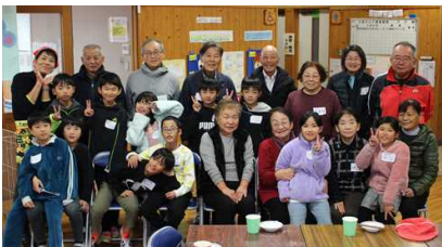
3・4年: 地域の方々との交流会