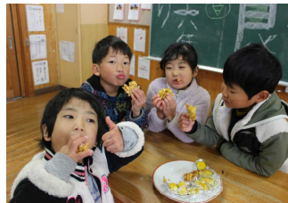
5・6年: 食生活改善推進員の皆様とスイートポテト・がね作り