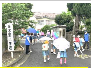
民生委員 あいさつ運動