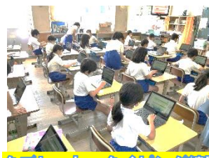
タブレット タイピング練習