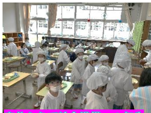
自分たちで給食準備 1年生