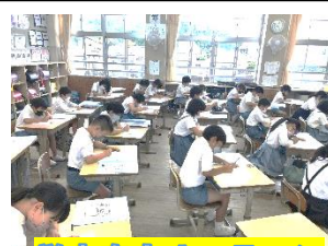
学力向上ルーティン