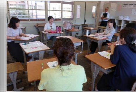
養護教諭部会の様子