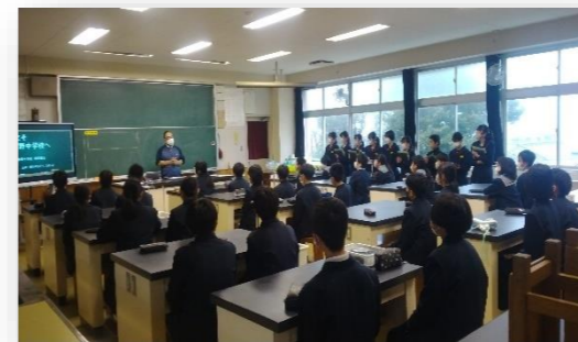
中学校の教室で中学校教諭による授業