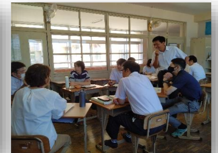
学力向上・学習部会の様子