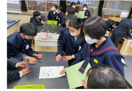
中学生がスモールティーチャー、サポーターになる活動