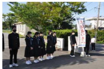
生徒会朝のあいさつ運動

これまで、しばらくお休みしていた西中の公式ブログを再開しました。生徒たちの日常の生活を中心に、ホットな話題や時には親子で考えていただきたいことなどをお届けいたしますので、スマホやパソコン、タブレットなどで確認していただくとありがたいです。