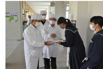
給食当番の爪のチェック