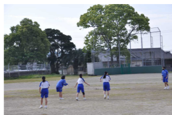
朝の体力作り(自主活動)