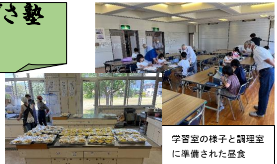
学習室の様子と調理室に準備された昼食

松原なぎさ校区コミュニティでは、毎月第1・3土曜日に「なぎさ未来塾」(10:30~11:50 参加者の自主学習を地域有志の方が個別支援), 「わいわい食堂」(11:50~13:00 女子部の方々の手作り昼食の提供)が開催されています。ぜひご利用ください。感謝!