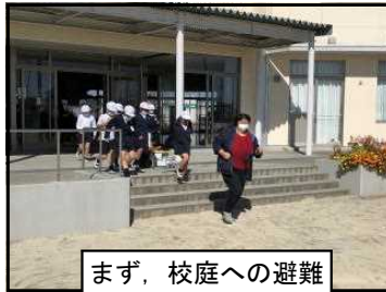
まず、校庭への避難

まず、地震発生の放送で、教室で揺れが治まるのを待ち、避難指示の放送で校庭へ避難しました。次に、津波注意報を受け、校舎屋上へと二次避難しました。