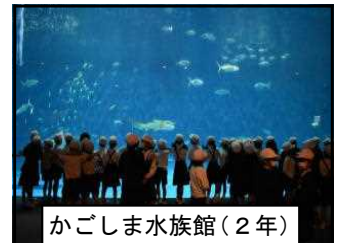
かごしま水族館(2年)

11月9日(月)に、1・2年生の一日遠足がありました。各学年とも、それぞれの場所で多くのことを学ぶことができました。天候にも恵まれ、充実した一日遠足となりました。