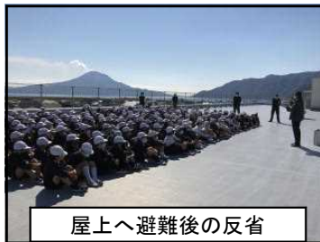
屋上へ避難後の反省

最後に校長先生から、「先生の話を目と耳と心でしっかり聞く習慣をつけること」、「落ち着いて行動すること」、この二つを普段から心がけることが自分や周りの人たちの命を守ることにつながるというお話がありました。