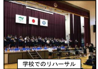
学校でのリハーサル

これまで練習を重ね、学校を代表して出場した音楽会で堂々と発表できたことで、子どもたちは自信を深め、やる気を高めてくれたことと思います。