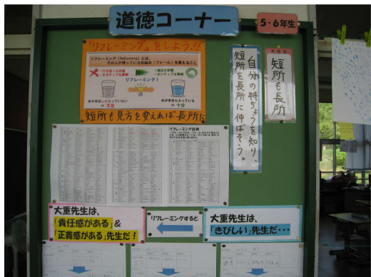
五・六年教室の廊下にある「リフレミング」の掲示