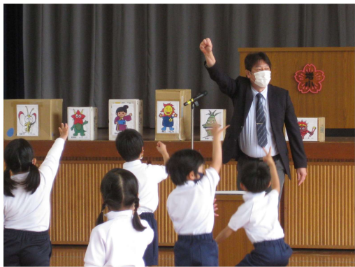
全校朝会での校長と児童の触れ合いの様子