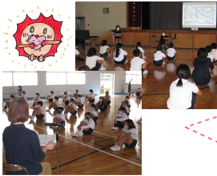
学校司書による読み聞かせより

さつても構いません。 都合の付く日に来てくださって ため学年を分けていますが 覧になれます。密を避ける 給食時間や休み時間も御 ○五日(金)五・六年生 ○四日(木)三・四年生 ○二日(火)一・二年生 (学校自由参観) 十時二十分から十四時十五分