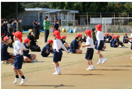
がんばったよ なわとび大会

これらは、子供たちの頑張りはもちろんのこと、保護者をはじめ児童クラブ他、地域や関係機関の皆様のお力添えがあったのことに深く感謝申し上げます。しかし、まだまだ細かく見ていけば課題は多いことと思います。また、継続していくことは難しいことでもあります。引き続き引き続き皆様の御支援・御協力をいただきますよう、よろしくお願ひします。令和三年度も一年間、本当にお世話になりました。春休みも子供たちが健康で安全に過ごし、新年度の心構えができますよう、声掛け等をお願いいたします。