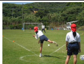
【ソフトボール投げ】

同様に、「体育の授業は楽しいか」という問いに、2年連続で男子は「楽しい・やや楽しい」が100%、女子は昨年88%、今年97%が「楽しい・やや楽しい」と回答し、「あまり楽しくない」という回答は12%から3%に改善しました。これは、児童全体が「体育の授業では進んで学習に参加している」と回答していることから、子供たちは運動の特性に触れた楽しさを味わいながら、多様な場で、主体的に授業に参加できていると言えます。本校ではこれからも、工夫を加えながら、さらに家庭や地域とも連携して、「運動好きな子供100%」を目指します。