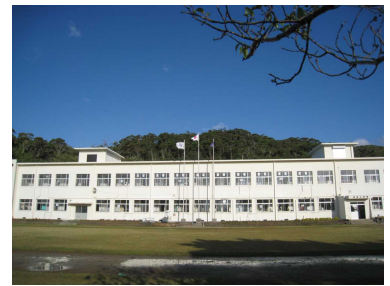
【令和5年度 学級編成】

「花・夢・あいさつでやさしさいっぱい増田小」～笑顔かがやくあったかさんの学校～のもと、元気よく、明るく、優しい学校経営を進めて参りたいと思います。何卒、保護者の方々や地域の方々の御理解と御協力をよろしく申し上げます。