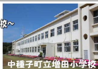
中種子町立増田小学校