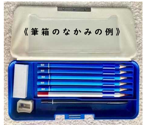
《筆箱のなかみの例》