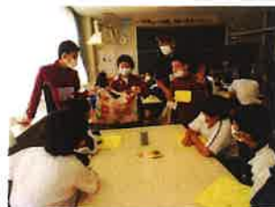
【作品について話を聞く】

11月8日(火)に、中種子養護学校との交流会が行われました。レクリエーションでは、パラリンピックの正式種目である「ボッチャ」を通して交流を深め、互いに自己紹介を行い、緊張もほぐれました。また、養護学校の作業学習で取り組んだ作品の紹介があり、1年生はその精巧な作りに大変驚いていました。楽しいひと時を過ごすことができました。