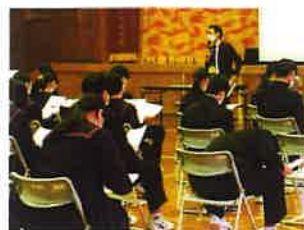
【種子島中央高校学科説明】

11月17日(木)に、島内の高等学校の学科説明会が行われました。種子島中央高等学校、種子島高等学校の先生方が来校され、種子島中央高校は情報処理科を、種子島高校は生物生産科と電気科を、それぞれの学科の特徴について、詳しくご説明いただきました。3年生はこれからの進路について考える良い機会となりました。以下、生徒の感想です。