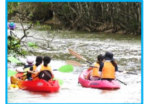
カヤック体験の様子

5月15日(水)から16日(木)にかけての一泊二日間、5・6年生は自然レクリエーション村で、油久小学校と合同による宿泊学習を行いました。