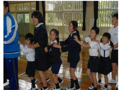
【じゃんけん列車で遊ぼう】

平成26年度のPTA役員をお知らせします。新執行部のもと、子どもたちの健康・安全、学校環境の整備など、学校の教育活動に多方面からの御協力をいただけると有り難いです。どうぞ、本年度もよろしくお願いいたします。