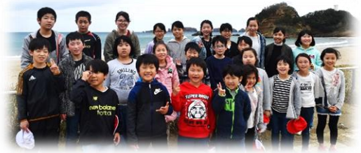
～南界小全児童26人 熊野海岸にて～

出発前の「6年生を送る会」や途中立ち寄った古市家住宅の「ひな人形見学」,友達と歩いた行き帰りの道のりなど,かけがえのない時間を26人全員で過ごすことができました。今年の思い出をまたひとつ増やすことができました。