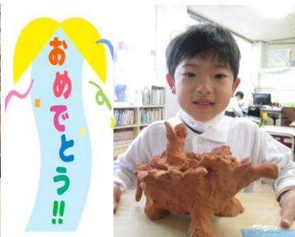
天までのぼるぞう