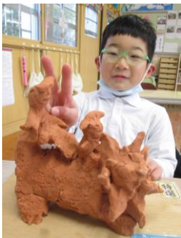
ライオンとあそぼう