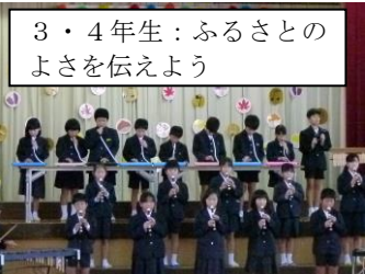
3・4年生：ふるさとのよさを伝えよう