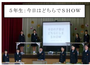
5年生：今日はどちらでSHOW