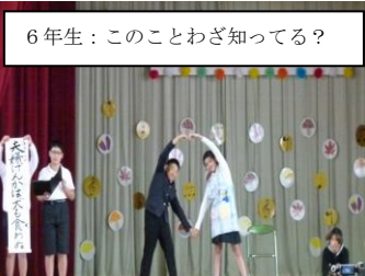
6年生：このことわざ知ってる？