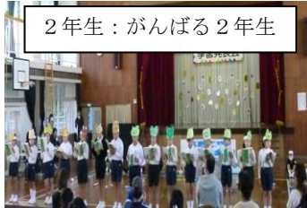
2年生：がんばる2年生