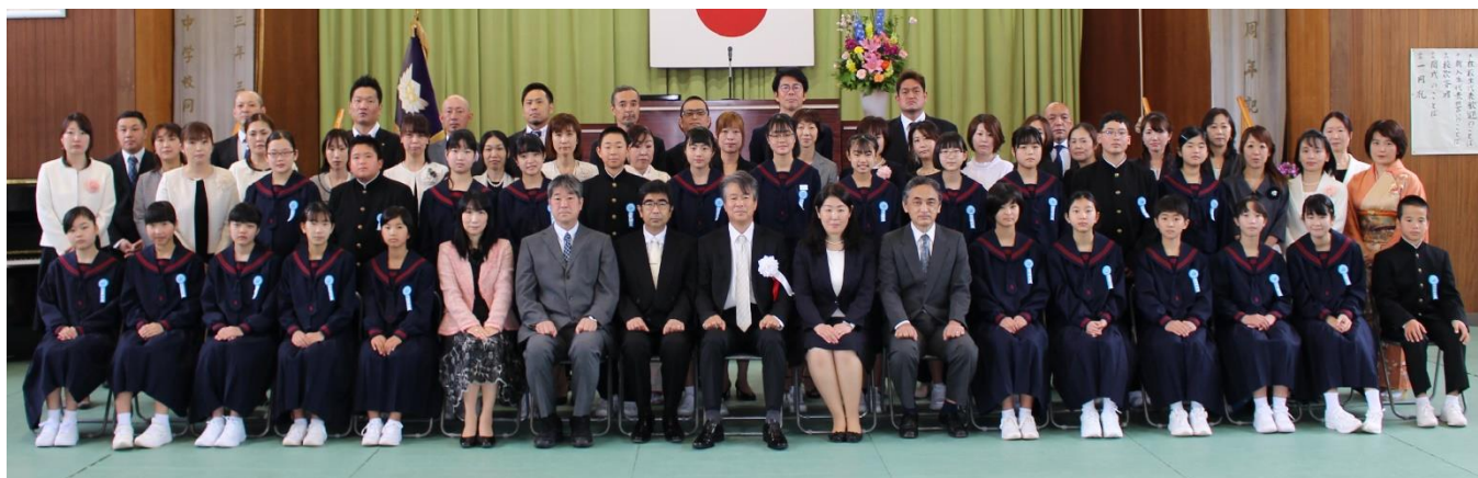
入学式後の記念撮影