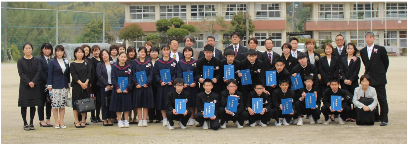
卒業式終了後の記念撮影