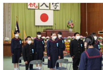
初めての校歌を聞きます。