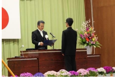
卒業証書授与・・・本年度は一人一人に学校長が手渡しました。