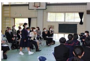
入場:中学校生活のスタートです。

4月6日（火）に、第75回入学式を行いました。本年度も、新型コロナウイルス感染防止を図るため規模を縮小しての開催となりましたが、無事に式を終了し、新入生は希望に胸に、中学校生活をスタートすることができました。心から感謝申し上げます。今後とも本校の教育活動への御指導・御支援を賜りますようお願い申し上げます。