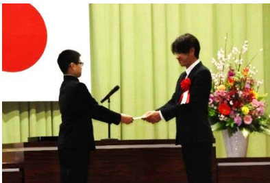
PTAより卒業生への記念品贈呈

3月16日(火)に、第74回卒業式が実施され、16名の3年生のみなさんが、通い慣れた学び舎を巣立っていきました。本年度も新型コロナウイルス感染症拡大防止ため、時間を短縮し、保護者2名までと代表来賓の参加のみの縮小版での実施となりました。4月からは、それぞれの道で頑張っていくことになります。幸多き人生を期待しています。