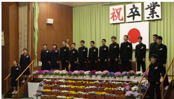
卒業生による旅立ちの唄「YELL」