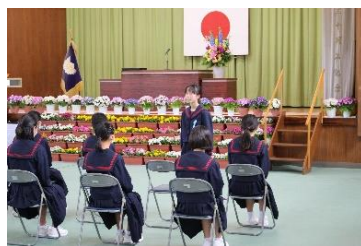
新入生点呼:よろしくお祈いします。