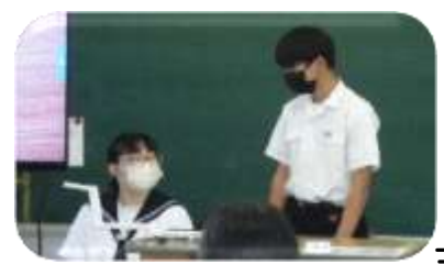
英語の絵本に挑戦！