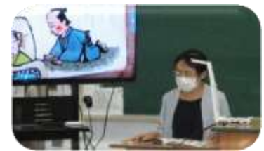
落語絵本で聞きごたえたっぷりです。