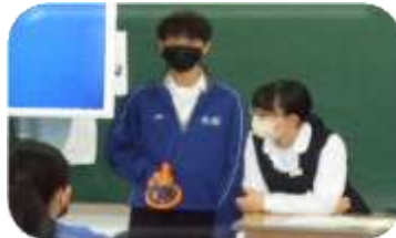
3年生による読み聞かせです。