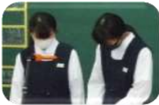
段々慣れてきました。(๑)