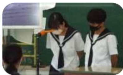
二人の息ぴったり！