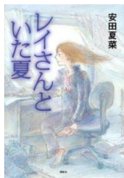
レイさんといた夏 安田夏菜 著