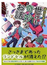
本当にあった？ 世にも奇妙なお話 たからしげる 編