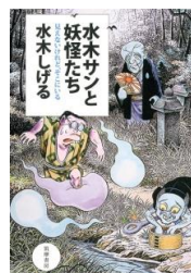
水木さんと妖怪たち 水木しげる 著