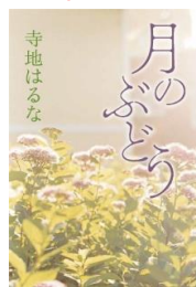
月のぶどう 寺地はるな 著