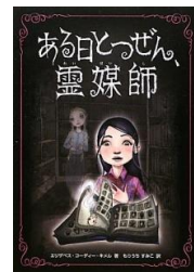
ある日とつぜん、 霊媒師 エリザベス・コーディ キメル 著