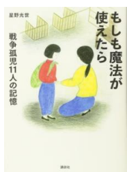
もしも魔法が使えたら 戦争孤児11人の記憶 星野光世 著