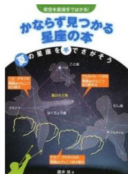
必ず見つかる 星座の本 (夏) 藤井旭 著