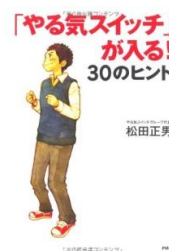
「やる気スイッチ」 が入る! 30のヒント 松田正男 著