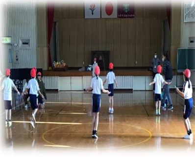
自己記録更新が続出!

8日スワリンピックを行いました。短縄とびや長縄でのエイトマン、新種目ののぼしてコロコロなどみんなで楽しく動きました。