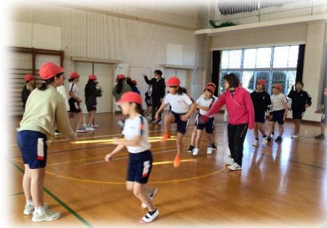
リズムよく跳びます!