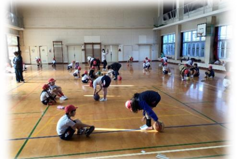
柔軟性があるほど有利