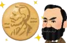
アルフレッド・ノーベル

また、2025年のノーベル賞では、大阪大学特任教授の坂口志文氏がノーベル生理学・医学賞を、京都大学特別教授の北川進氏がノーベル化学賞をそれぞれ受賞されました。坂口氏は、「免疫応答を抑制する仕組みの発見」が「がん」など免疫に関わる病気の予防や治療につながると評価されました。北川氏は、気体を自由に出し入れできる「金属有機構造体（MOF）の開発」が評価され、二酸化炭素の吸着や水素の貯蔵などが環境・エネルギー問題の解決へつながると期待されています。自分を信じて長年粘り強く研究を続けたノーベル賞受賞者のお二人は、化学者としての発見や開発が両氏の夢実現と「人類に最大の貢献をもたらした人々」として認められました。それは科学技術の発展に多大な影響を与える夢のような発見と開発となったのです。両氏は「論文を出しても掲載を断られたり、研究を否定されたりした」、「たたかれて涙か汗か分からない経験をした」と今までを振り返り、 しんぼう強く自分を信じて努力を重ねてきた成果だと語っていました 。いつの時代も新しいことにチャレンジする時は逆風や圧力が付きものです。お二人が大事なことを次のように話されています。「苦しいときにあっても興味を持続して努力を続けることが大切」、「興味のあることを大切にすると新しいものが見えてくる」。このことから 非認知能力 がとても大事であることが分かります。学力やテストでは測れない非認知能力とは、「 目標を達成する力 ：意欲、自信、やり抜く力、情熱」、「 自己を高める力 ：新しい発想、忍耐力、自尊心」、「 他者と関係する力 ：協調性、コミュニケーション能力、思いやり」等をいいます。夢に近づくためには非認知能力は欠かせない能力なのです。創造する、チャレンジする、夢をかなえる、そんな私らの形をつくるために、日常生活の中で聴き合い学び合い成長できると良いですね。（参考文献：みんなの教育技術、サイエンスポータル、ザ・ハイロウズ楽曲）