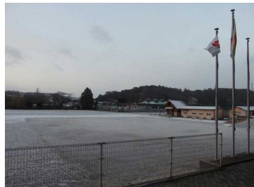
校庭一面に積もった雪

今年度初めて、財部中に雪が積もりました。生徒の中には、久々に見る雪にはしゃいでみたり、雪が積もった校庭に出て走ってみたりするなど、いつもとは違う景色に胸を躍らせていました。路面凍結の際には、滑ることがあるので登下校には十分に気を付けましょう。自分が気を付けていても車が突っ込んでくる場合もありますので周りにも気を配ってください。