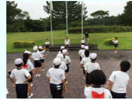
夕べの集いの様子