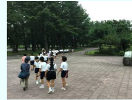
ナイトウォークに出発