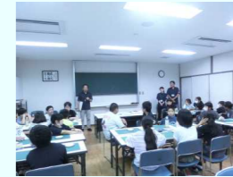
木ホルダーづくり