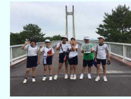
フォトアドベンチャーの様子