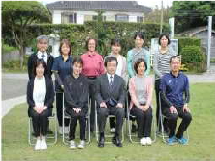
【令和4年度・油久小職員『Team油久』】

3月に6名の卒業生を見送り、お世話になった先生方との別れがあり、入学式のない春を不安に感じていました。